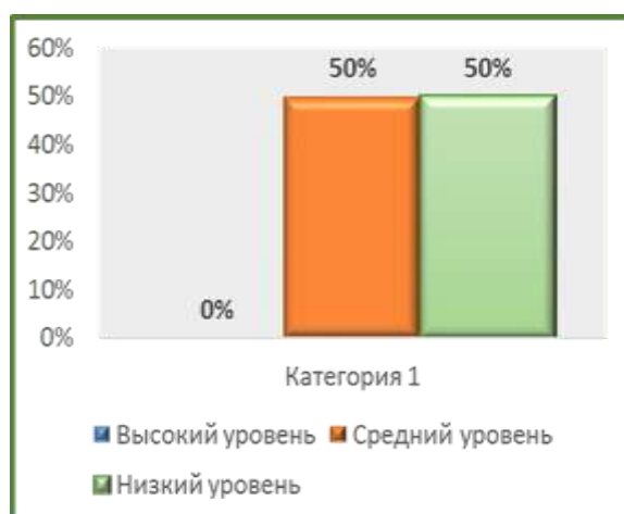
Оценка сформированности финансовой грамотности у воспитанников в начале реализации проекта